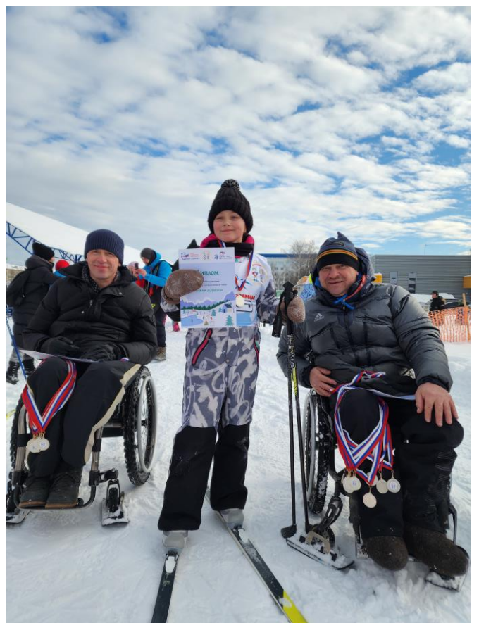
Московская область, г. Ивантеевка