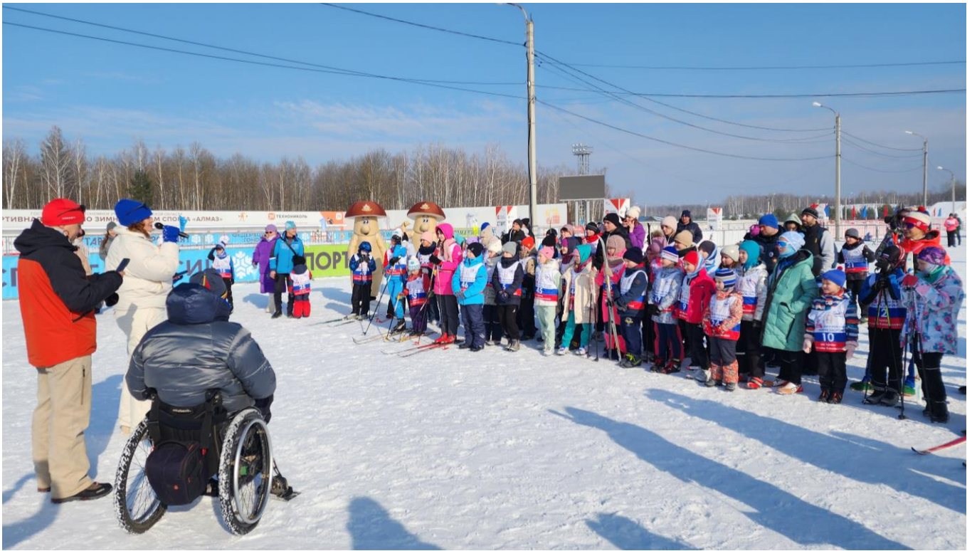
Рязанская область, поселок Варские