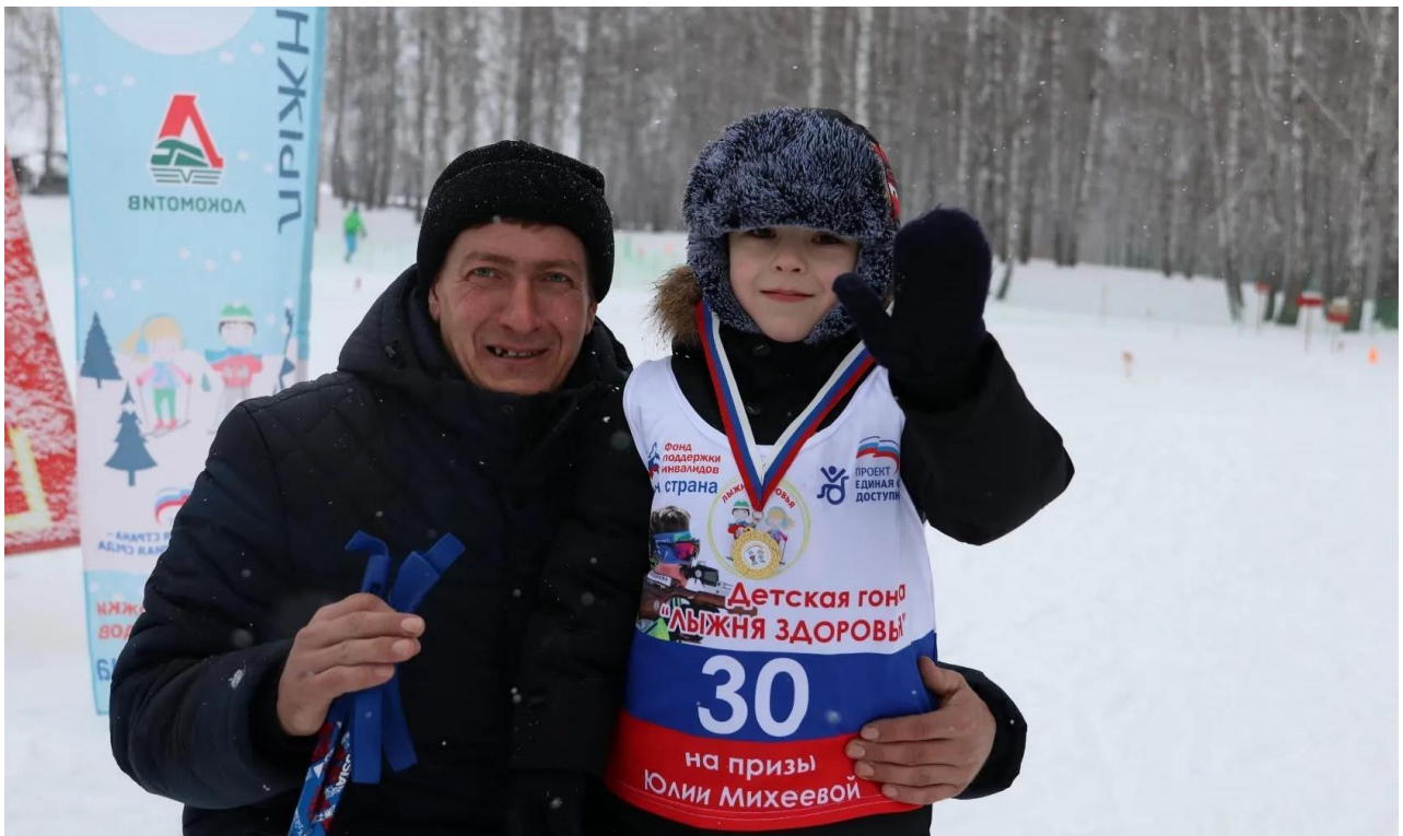
Томская область, село Кожевниково