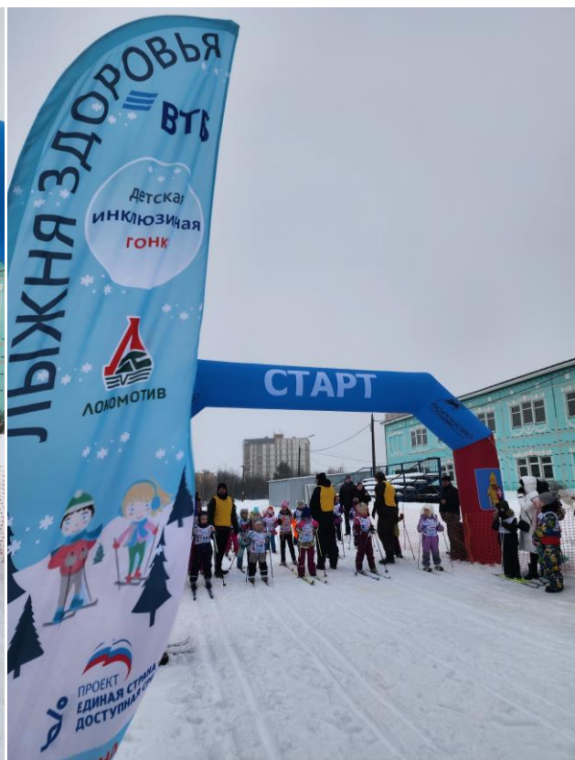
Москва, деревня Троица, поселение Вороново