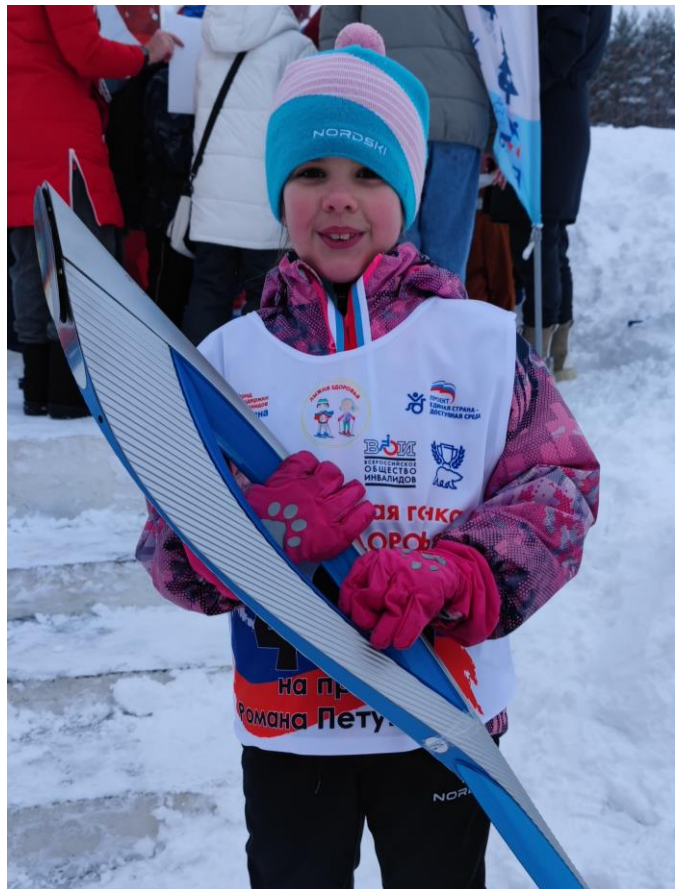
Московская область, г. Дмитров