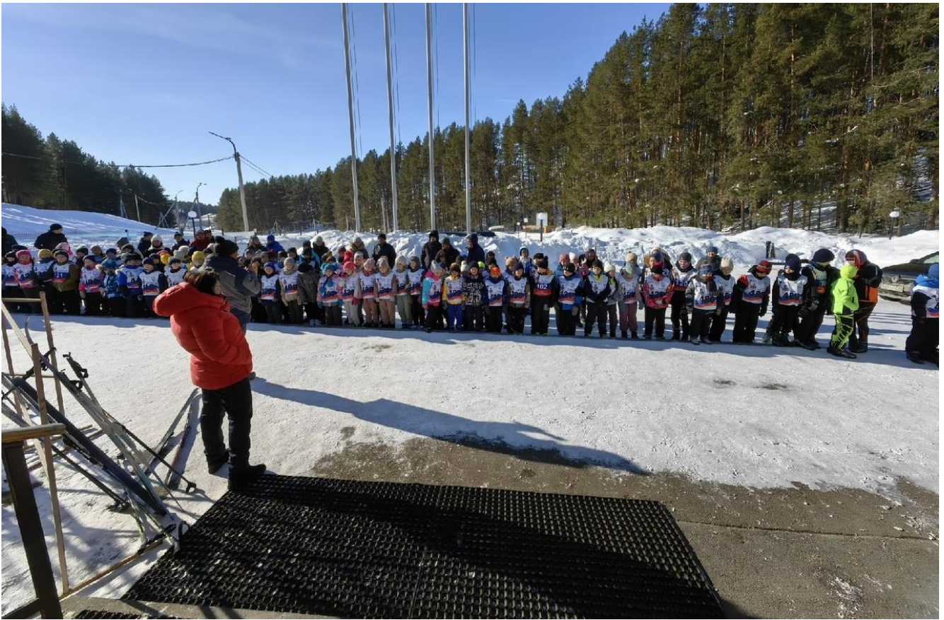
Удмуртская Республика, село Алнаши