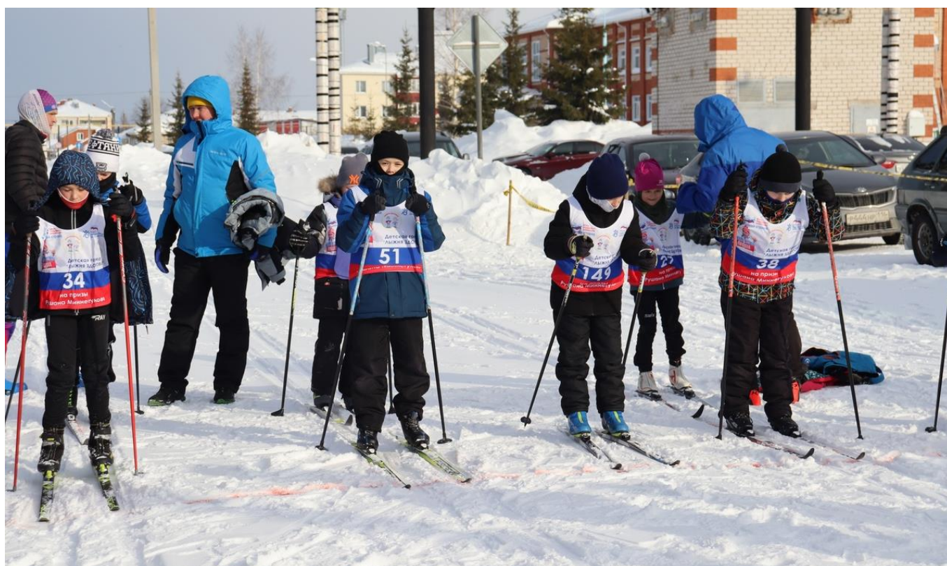
Республика Татарстан, с. Шемордан