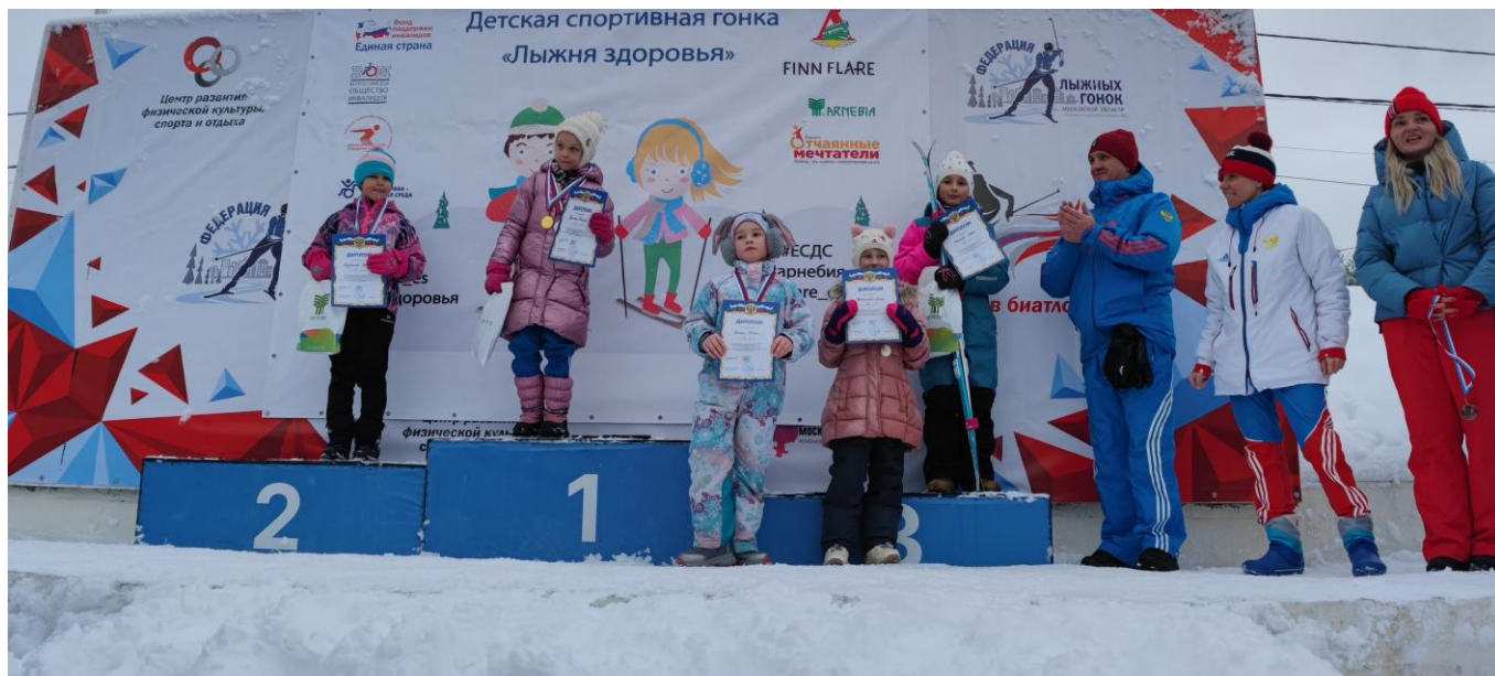
Московская область, г. Дмитров