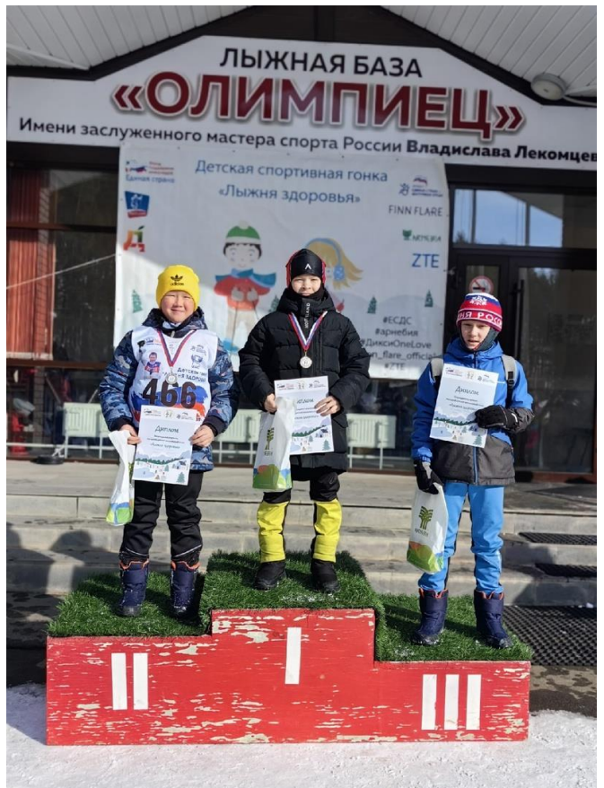
Удмуртская Республика, село Алнаши