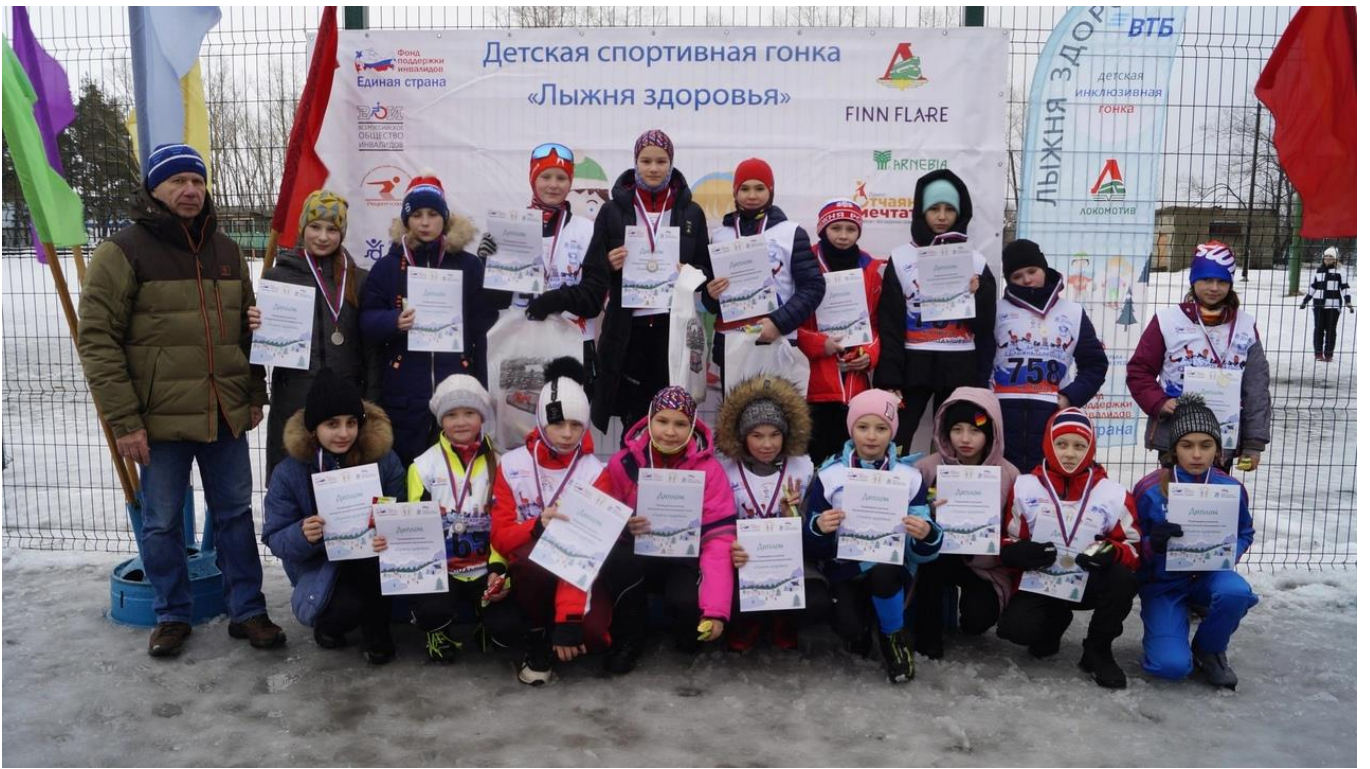
Алтайский край, село Большое Енисейское