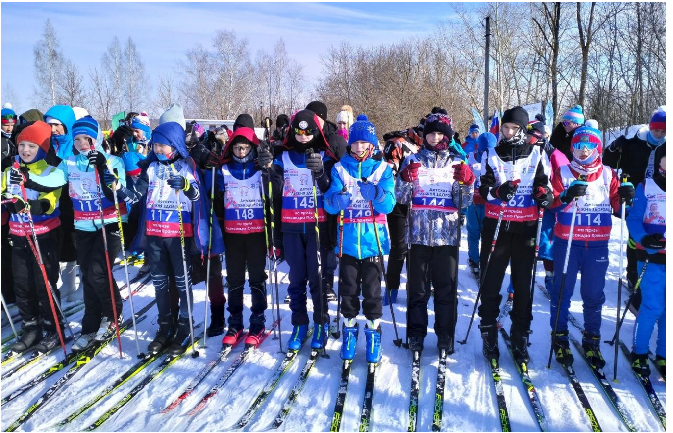
Пензенская область, село Лопатино