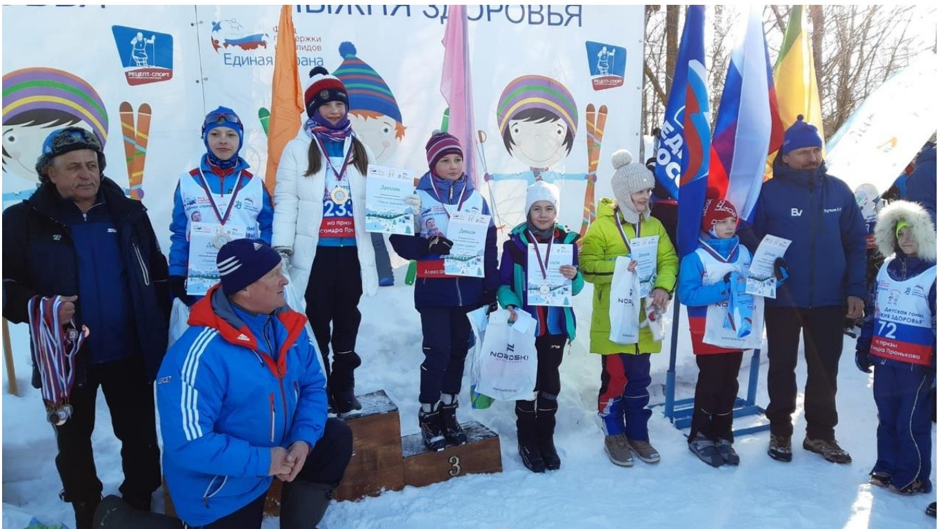
Пензенская область, село Лопатино