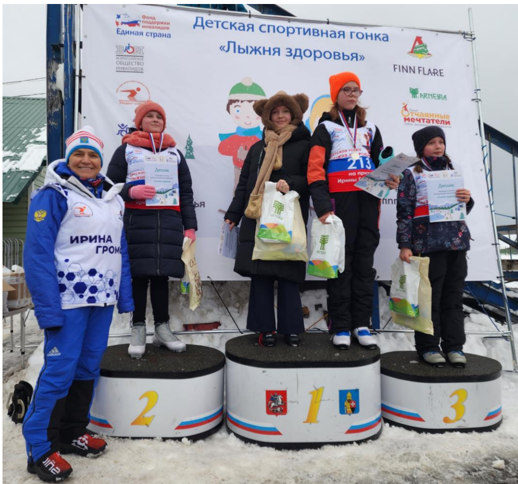
Москва, деревня Троица, поселение Вороново