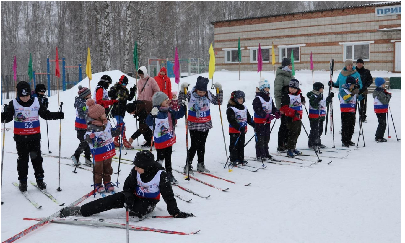
Томская область, село Кожевниково