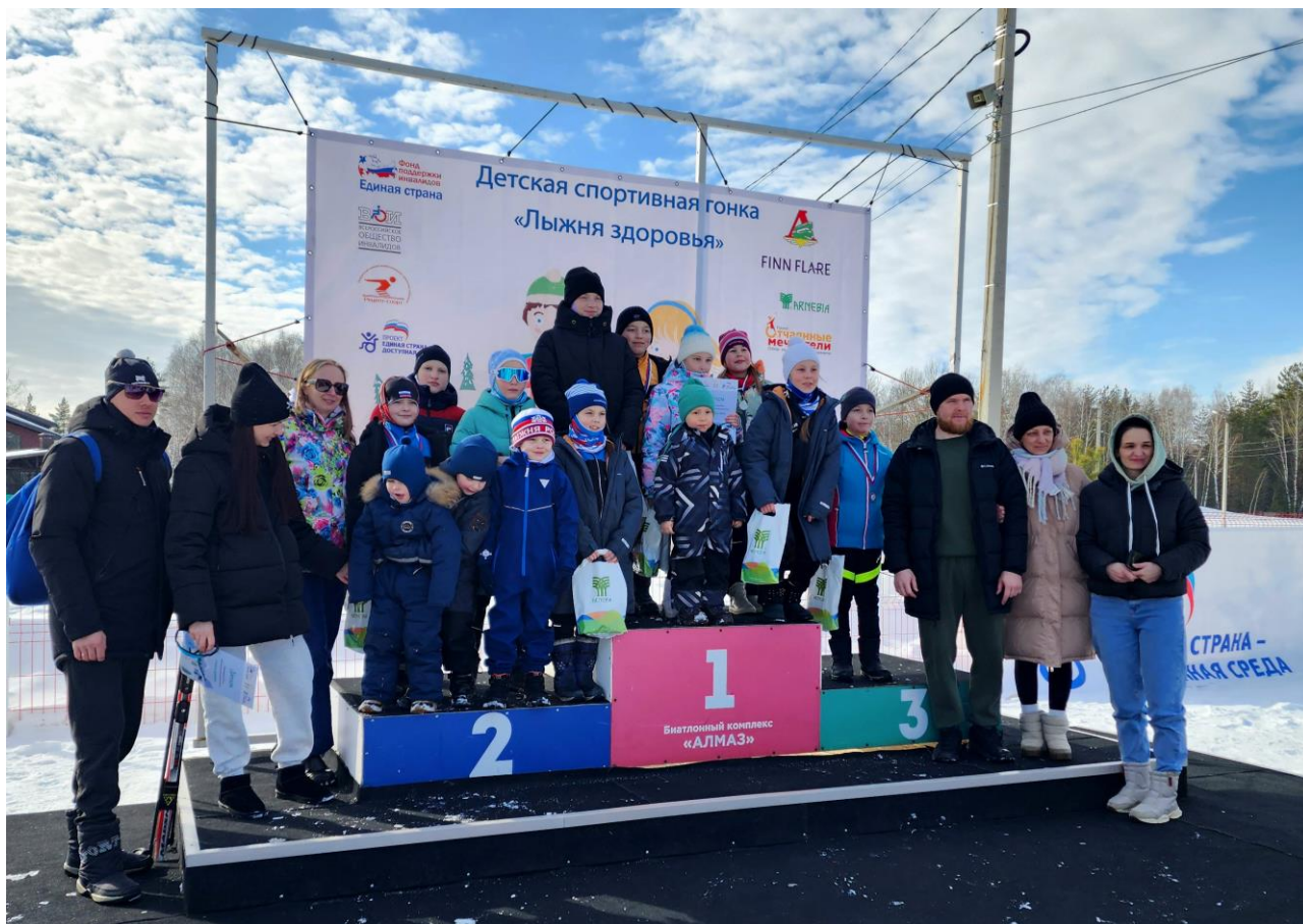
Рязанская область, поселок Варские