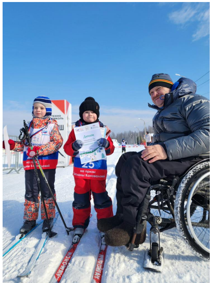
Рязанская область, поселок Варские