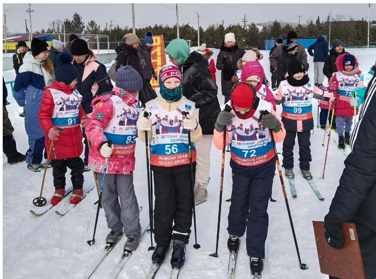
Алтайский край, село Смоленское