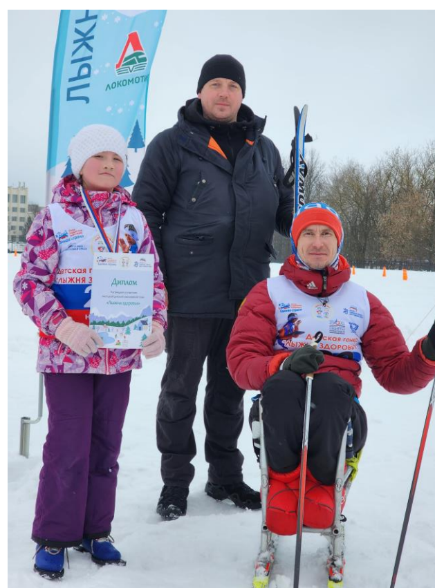
Москва, деревня Троица, поселение Вороново