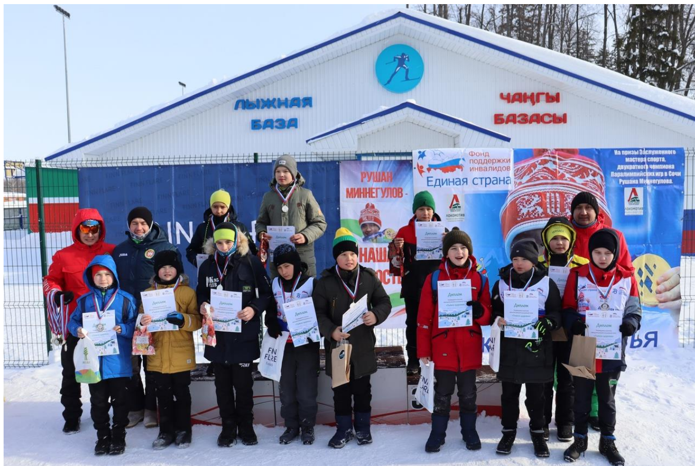
Республика Татарстан, с. Шемордан