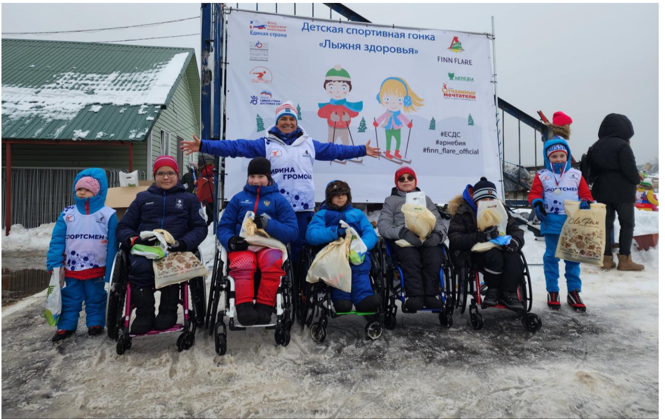
Москва, деревня Троица, поселение Вороново