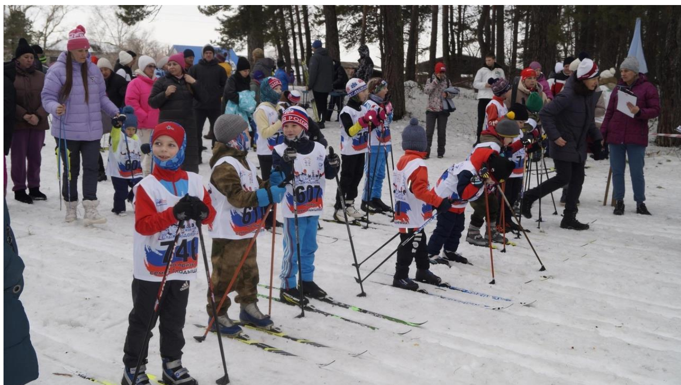
Алтайский край, село Большое Енисейское