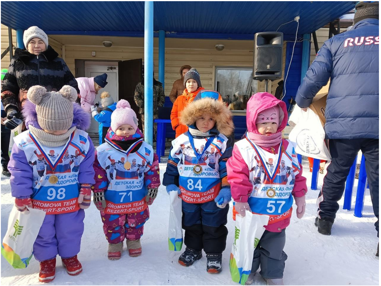
Алтайский край, село Смоленское