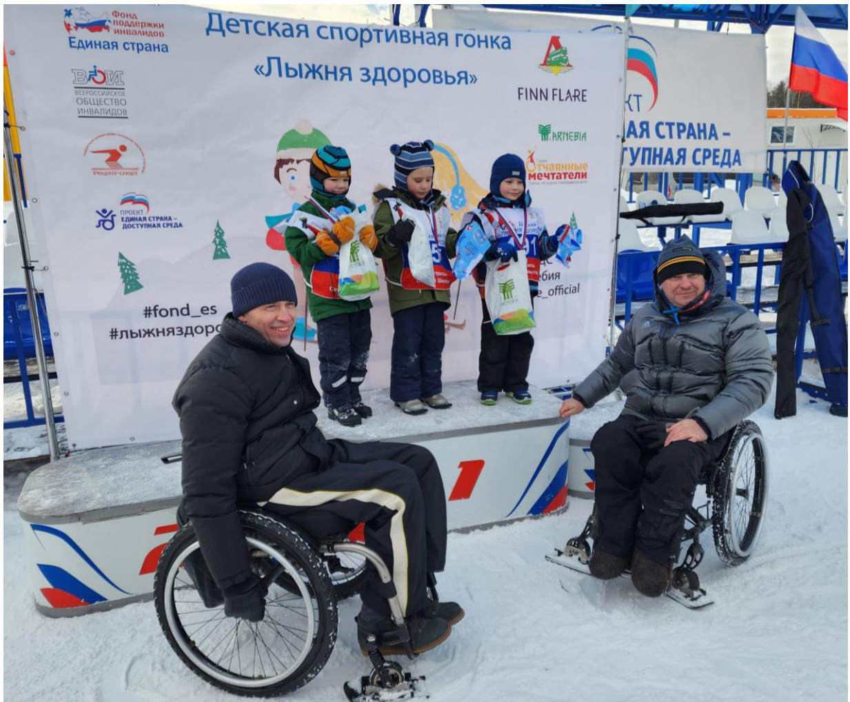
Московская область, г. Ивантеевка