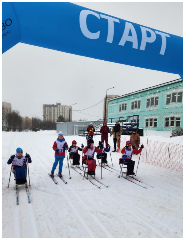
Фото-отчет Детская инклюзивная спортивная гонка «Лыжня здоровья» 2024 г.