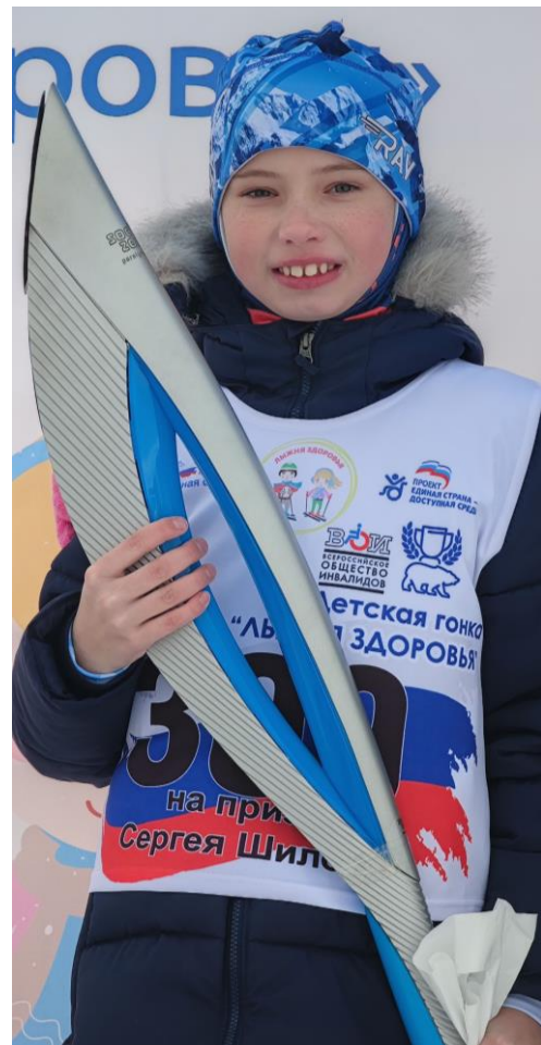
Московская область, г. Ивантеевка