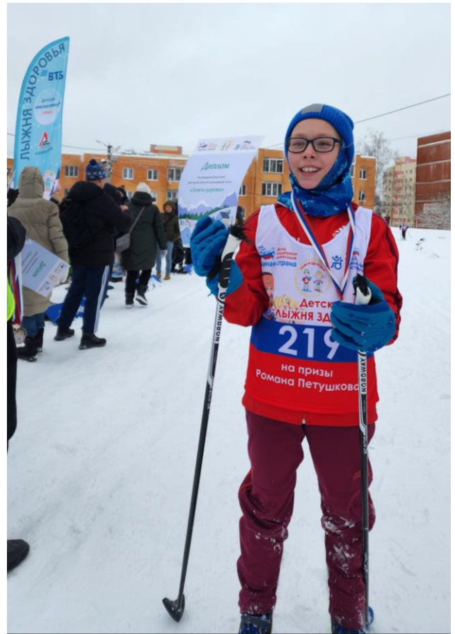
Московская область, г. Дмитров